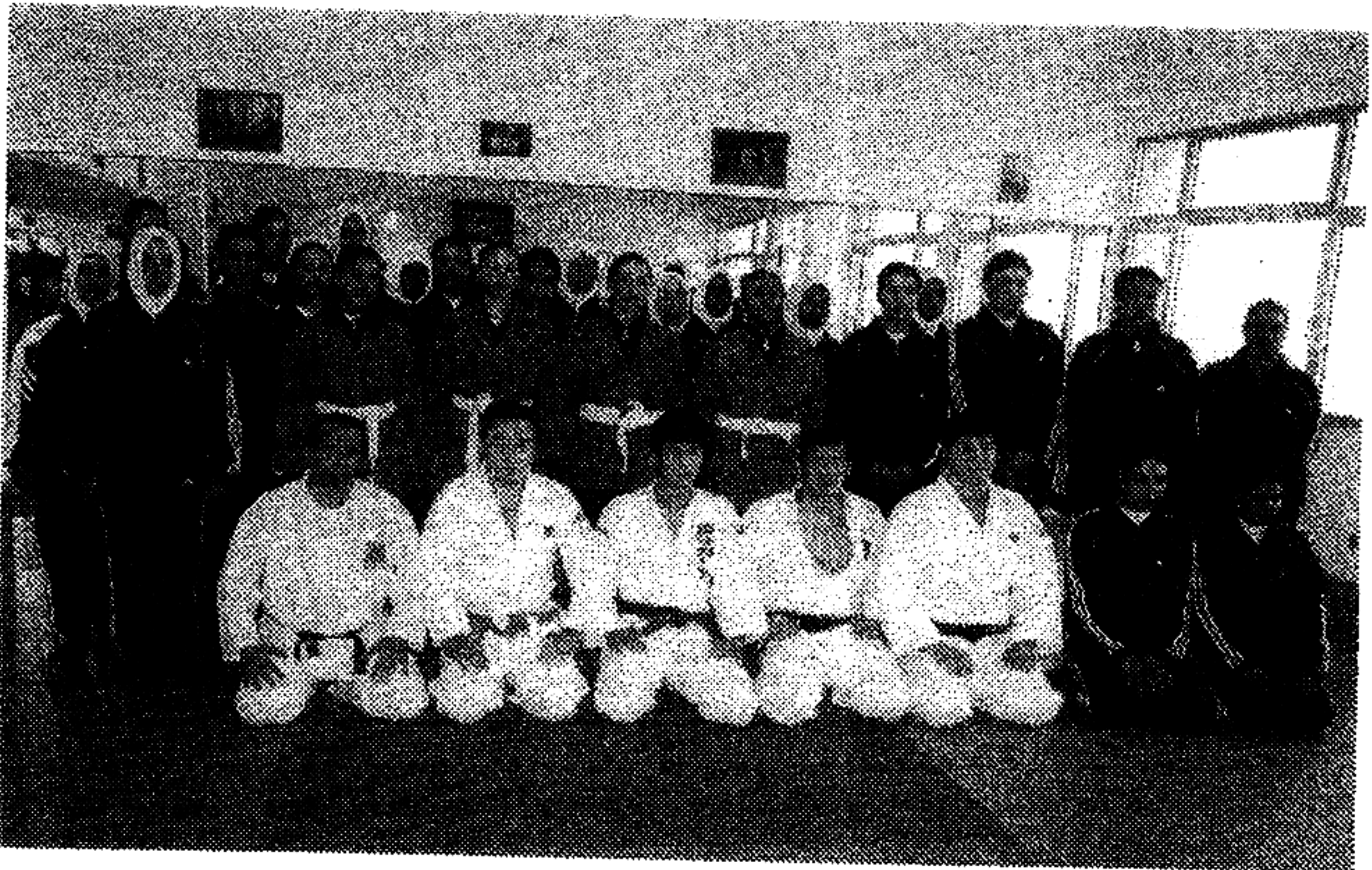
リビア女性警察大学校での指導を終えて

3日目の最終日には、全国青年大会が実施され、決勝戦の終了後、私たちのデモンストラクションを実施した。